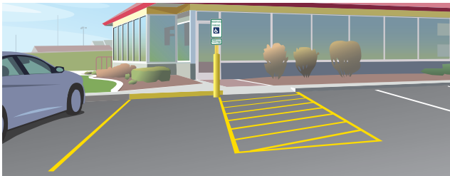
Arriba: Ilustración de un espacio de estacionamiento accesible angulado legal.

Cualquier instalación que ofrezca estacionamiento para empleados o visitantes debe proporcionar estacionamiento accesible a personas con discapacidades. Un espacio de estacionamiento accesible consiste de un espacio para el vehículo y un pasillo de acceso con líneas diagonal. En todo momento, el espacio entero deberá de ser mantenido libre de obstrucciones-incluso hielo, nieve, corrales de carritos de compras, cestos de basura, exhibidores temporal de jardín y armazones de bicicletas.